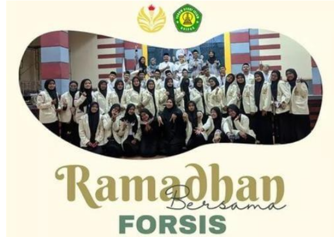
#Ramadhan bersama Forsis