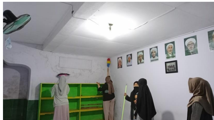
#Piket Pengurus dan anggota