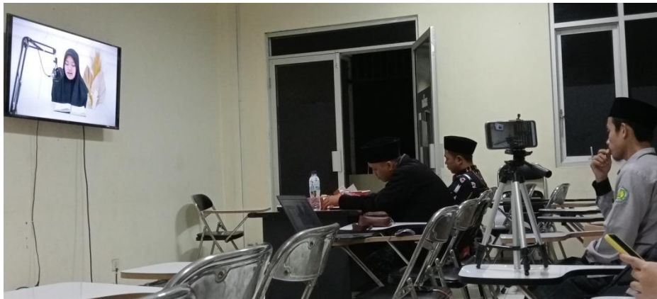
#MTQ Prov 2023